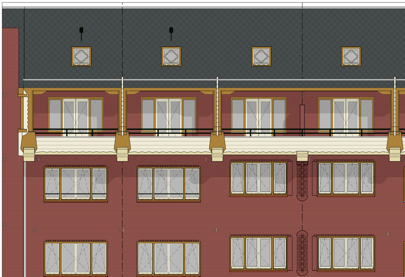
amstelveenseweg 221 eerste t/m derde verdieping