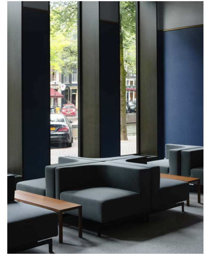
Zicht naar Kloveniersburgwal