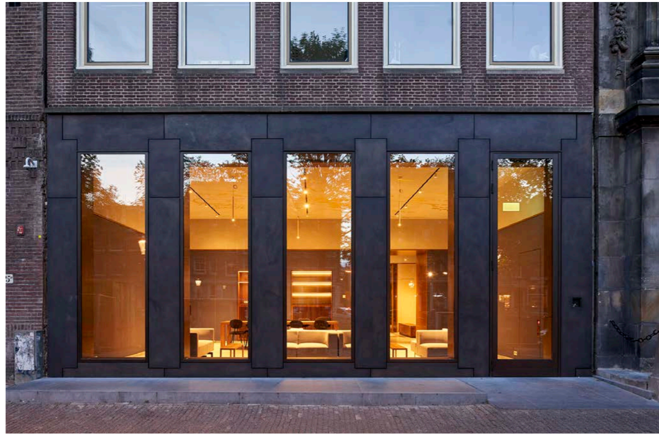
De nieuwe gegoten bronzen gevel

De transformatie van pand 27 stelt de KNAW in staat hun rol in de veranderende samenleving te tonen. De 'open' gevel van de nieuwe ontvangstruimten en de vernieuwde Tinbergenzaal dragen zichtbaar bij aan de transformatie van het gesloten instituut, ze geven het een uitnodigend en representatief 'gezicht' naar de stad wat het gebouw sociaal duurzaam maakt.