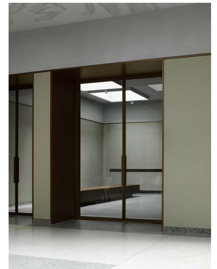
Enfilade van ruimten vanuit de ontvangst