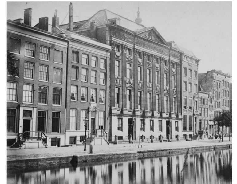
Historische situatie Trippenhuis, ca. 1870