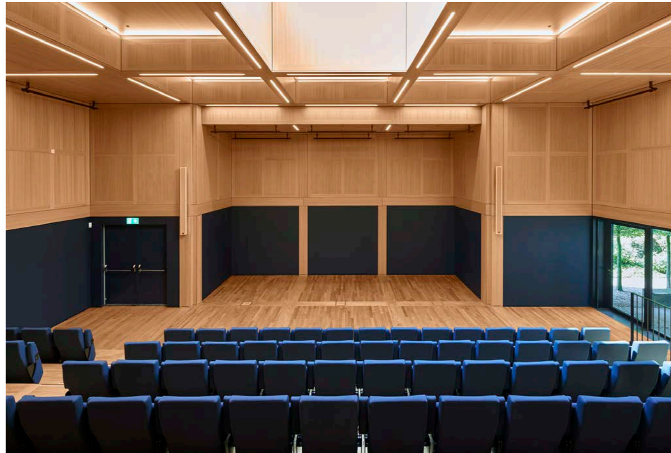
Het nieuwe ontwerp voor de Tinbergenzaal