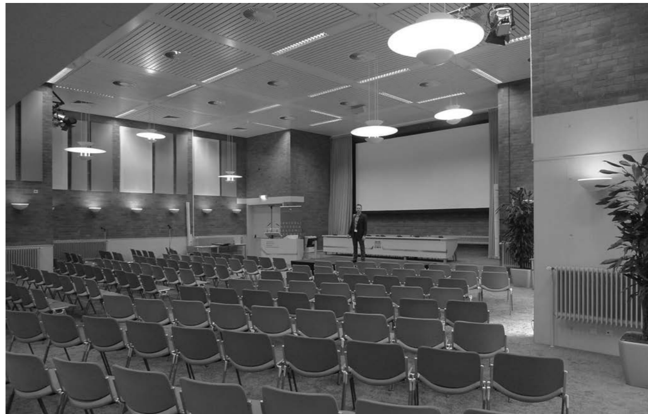
Tinbergenzaal voor de transformatie