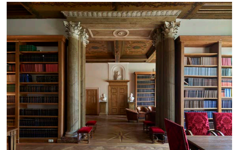
De monumentale bibliotheek