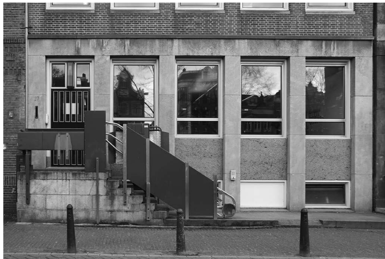
Gevel met entree voor de transformatie