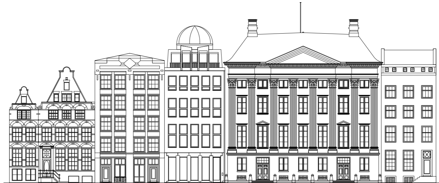
Geveltekening van het monumentale Trippenhuis en de belendende panden

Hoewel het gebouw door de jaren heen met uiteenlopende inzichten werd getransformeerd, wist het zijn essentiële glorie te behouden. Het huidige complex bestaat uit meerdere gebouwen die deels met elkaar verbonden zijn en als ensemble samen het Trippenhuiscomplex vormen. Sinds 1812 is het KNAW gehuisvest in het Trippenhuis en biedt het complex ruimte aan medewerkers en gasten. Vergaderingen en symposia worden gehouden in het monumentale gebouw en het aangrenzende pand.