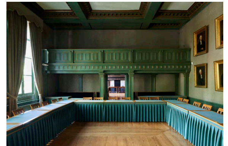
De monumentale bestuurskamer