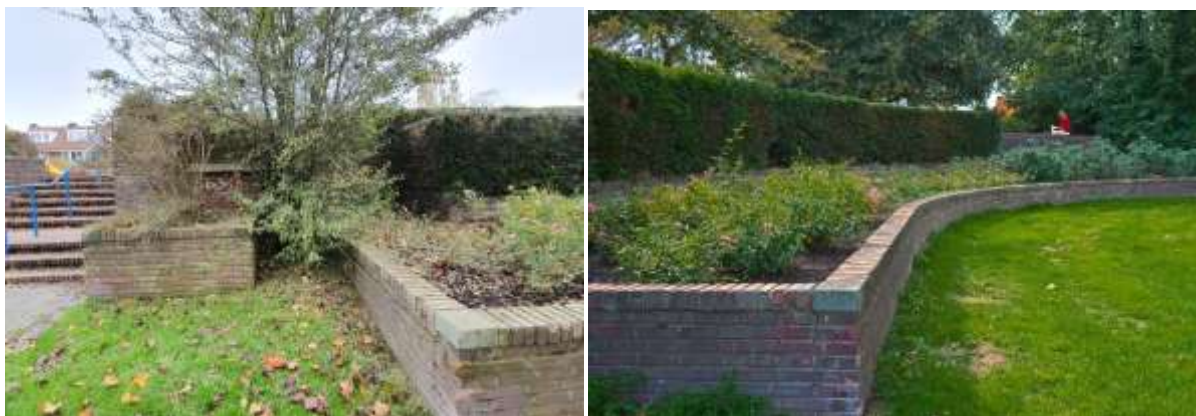
Plantsoen met terrasstructuren op de hoek van de Graaf Aelbrechtlaan en Wolfert van Borsseleweg.

Het spoorwegtracé is aangewezen als gemeentelijk monument en wordt beschreven en gewaardeerd in de waardestelling van 9 april 2019. Bij de beoordeling van vergunningaanvragen is de redengevende omschrijving het uitgangspunt en daarom wordt dit rapport tevens van kracht voor het beschermd stadsgezicht. Voor Elsrijk-west is het hoogteverschil tussen de spoorweg, die op een dijk ligt, en de directe omgeving van belang.