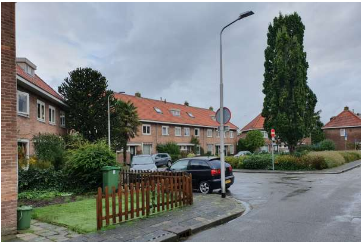
Zicht op de Jan Hudestraat.