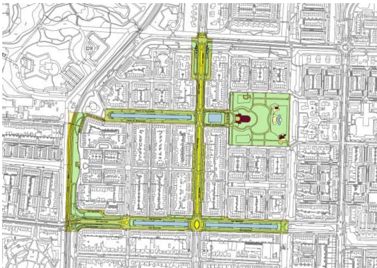
Begrenzingsgebied beschermd stadsgezicht Elsrijk-West, bron: Gemeente Amstelveen.