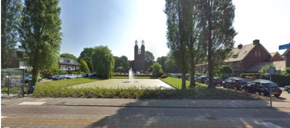
Charlotte van Montpensierlaan gezien richting de Kruiskerk.