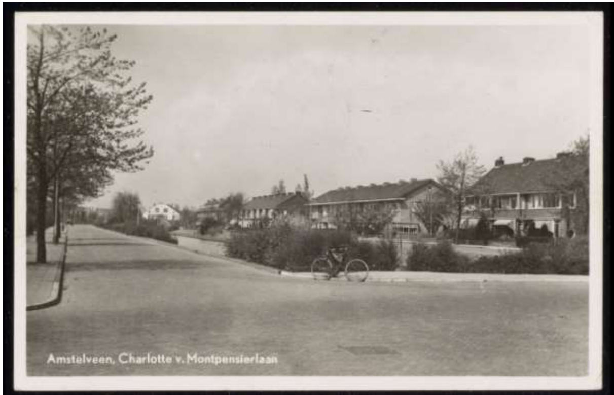
Historische foto van de Charlotte van Montpensierlaan, datum onbekend, bron: NH-archief.

gemoderniseerd en onderhouden, hierdoor is de eenheid in architectuur behouden gebleven. Doordat de woningen aan een plantsoen liggen, vormt de Jan Huddestraat een klein hofje. Het plantsoen aan de Jan Huddestraat is van oudsher beplant met sierbeplanting. Er staan twee zuileiken in en de sierbeplanting is een aantal jaren terug vernieuwd. Elsrijk ontleent haar groene karakter aan dergelijke plantsoenen en aan het openbaar groen langs de woonstraten.