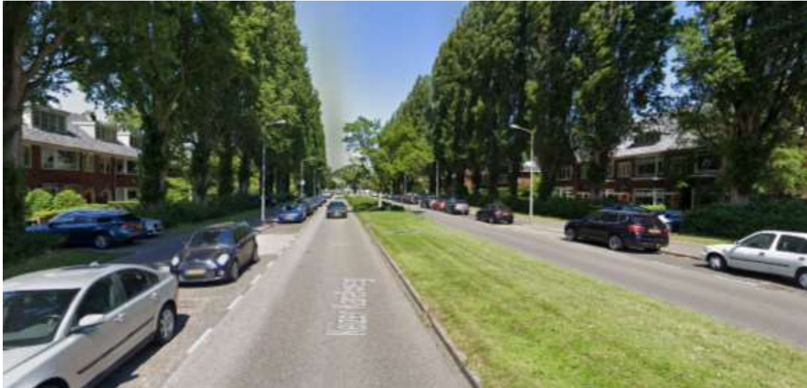
De Keizer Karelweg gezien richting het noorden.