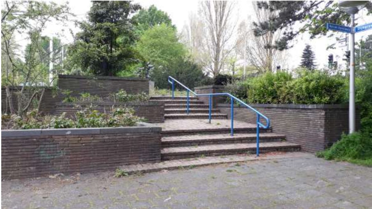
Plantsoen met terrasstructuren op de hoek van de Keizer Karelweg en de Laan Walcheren.

De beplanting in de gemetselde bakken bij de Graaf Aelbrechtlaan en de Keizer Karelweg bestaat uit lagere sierbeplanting en enkele groenblijvende soorten. Er staan bijvoorbeeld verschillende soorten rozen en wat Azalea's. De groene heesters worden de laatste tijd geschoren, wat het architectonische karakter versterkt. Dit is echter niet origineel. In de bakken staan, op een linde bij de spoorwegovergang na, geen bomen.