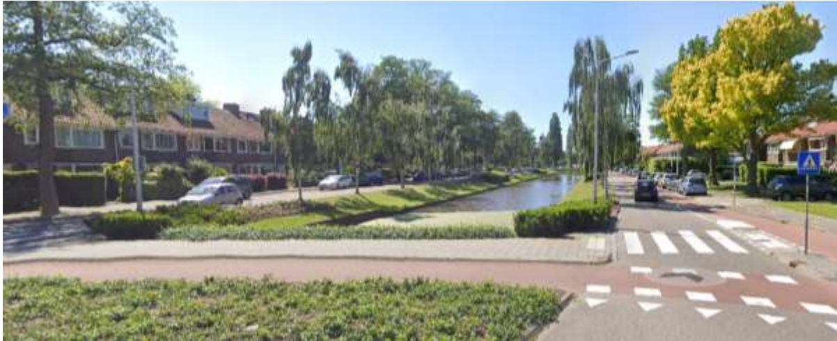
De Graaf Aelbrechtlaan gezien richting het westen.