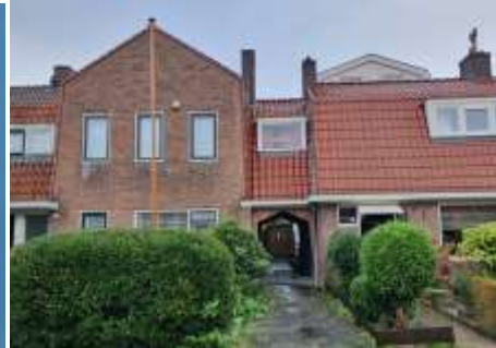
Links: Uitsnede uit de blauwdruk voor het stratenplan van de Jan Hudestraat, d.d. 1922, Bouwarchief gemeente Amstelveen. Rechts: woningbouw aan de Bergervaarderstraat die typerend is voor de tuinsteden in Nederland.