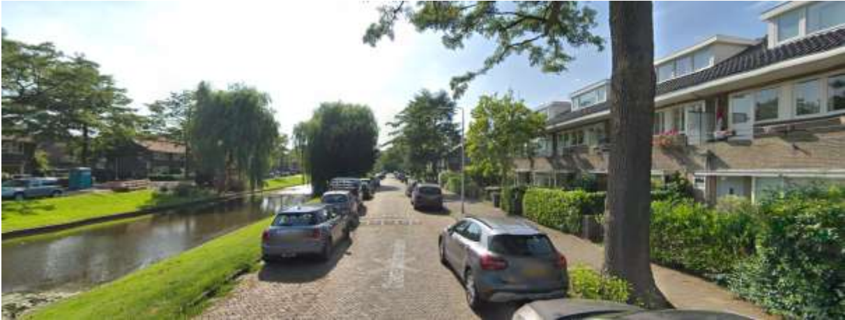
Charlotte van Montpensierlaan gezien richting het westen. Inrichting van de openbare ruimte.

Aan weerszijden van het water ligt de straat, die toegankelijk is voor autoverkeer (éénrichtingsverkeer). Met uitzondering van de Keizer Karelweg, die geasfalteerd is, zijn de wegdekken voorzien van klinkerbestrating. Langs de straten liggen de met stoeptegels belegde stoepen. Alle woonblokken hebben een voortuin, de erfgrans wordt afwisselend met heggen of hekjes aangegeven. Bij enkele percelen is de erfafscheiding hoger dan 1,50 meter, waardoor het zicht op de voortuin en de voorgevel belemmerd wordt. Bij enkele percelen is een oorspronkelijke lage gemetselde erfafscheiding behouden gebleven.