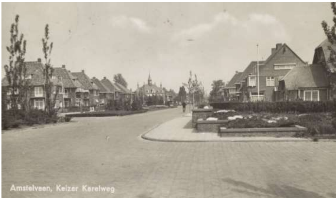
Terrasstructuren in Elsrijk, datum onbekend, bron: beeldbank NH-archieff.