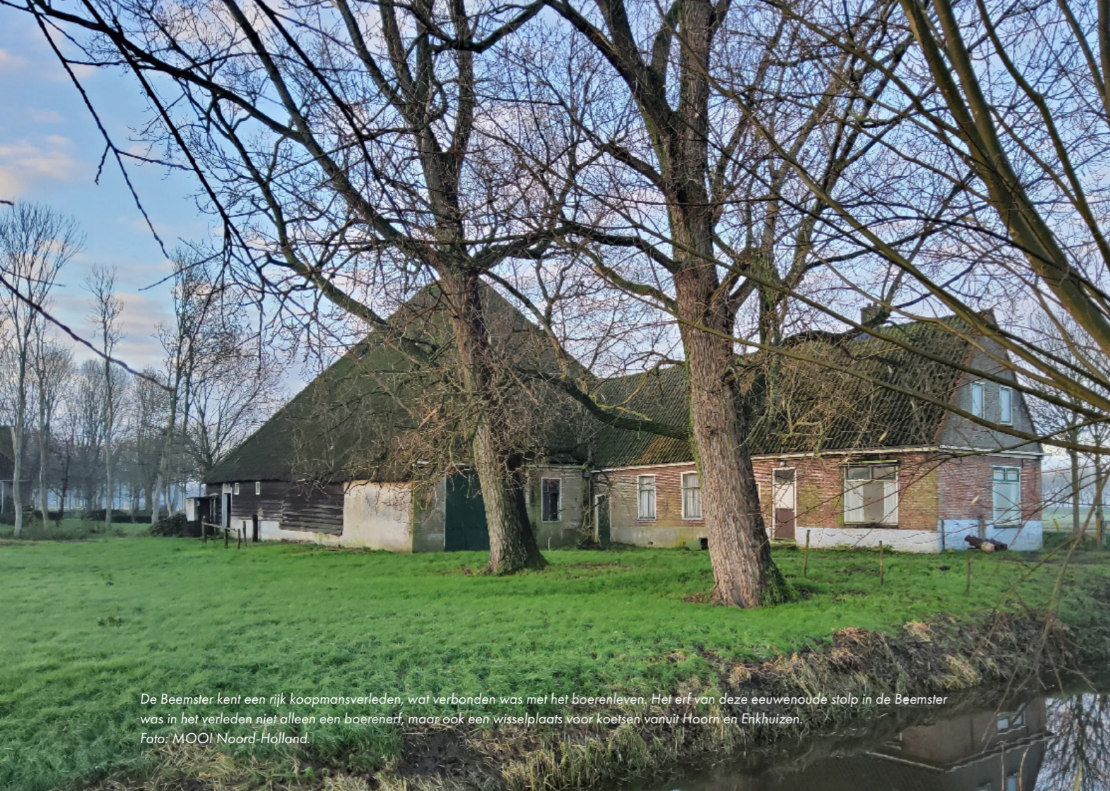
De Beemster kent een rijk koopmansverleden, wat verbonden was met het boerenleven. Het erf van deze eeuwenoude stolp in de Beemster was in het verleden niet alleen een boeren erf, maar ook een wisselplaats voor koetsen vanuit Hoorn en Enkhuizen.

Binnen de Collectie De stolpboerderij als gebouw is een ordening aangebracht omdat daar grote verschillen aanwezig zijn waar specifiek beleid aan gekoppeld zou kunnen worden. De staat van onderhoud heeft niet meegewogen bij de indeling in ordes. Opvallend is wel dat stolpen die vanuit architectuurhistorisch oogpunt van hoge waarde zijn, vaak niet het beste onderhouden zijn. Dit heeft met elkaar te maken: door weinig onderhoud is de architectuurhistorische waarde goed geconserveerd. Dit maakt deze bijzondere categorie echter ook heel kwetsbaar. De ordes zijn gedetailleerd omschreven en toegelicht in het beleidsadvies.