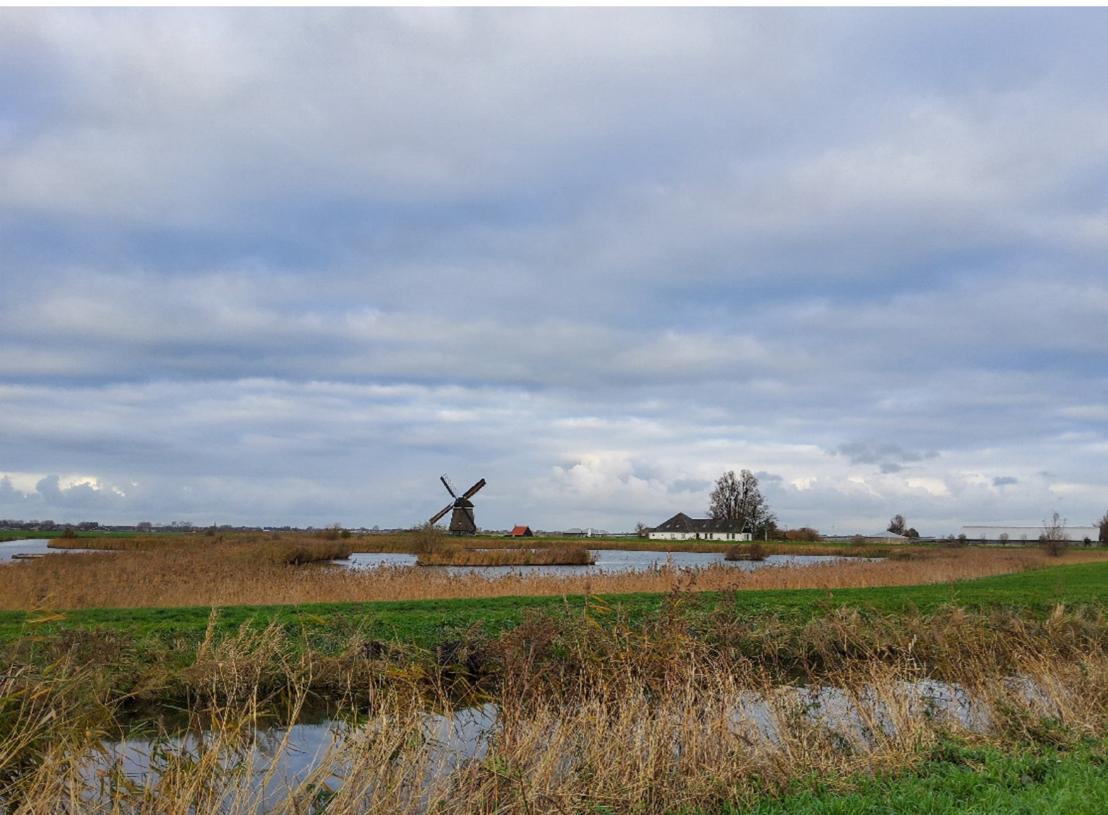
Deze onvolledige stolp met voorhuis is een markant voorbeeld van de collectie De stolp in het Landschap vanwege de solitaire ligging ver in het landschap nabij monumentale molen in Hensbroek. De stolp is van alle kanten een opvallende verschijning in het vlakke landschap.