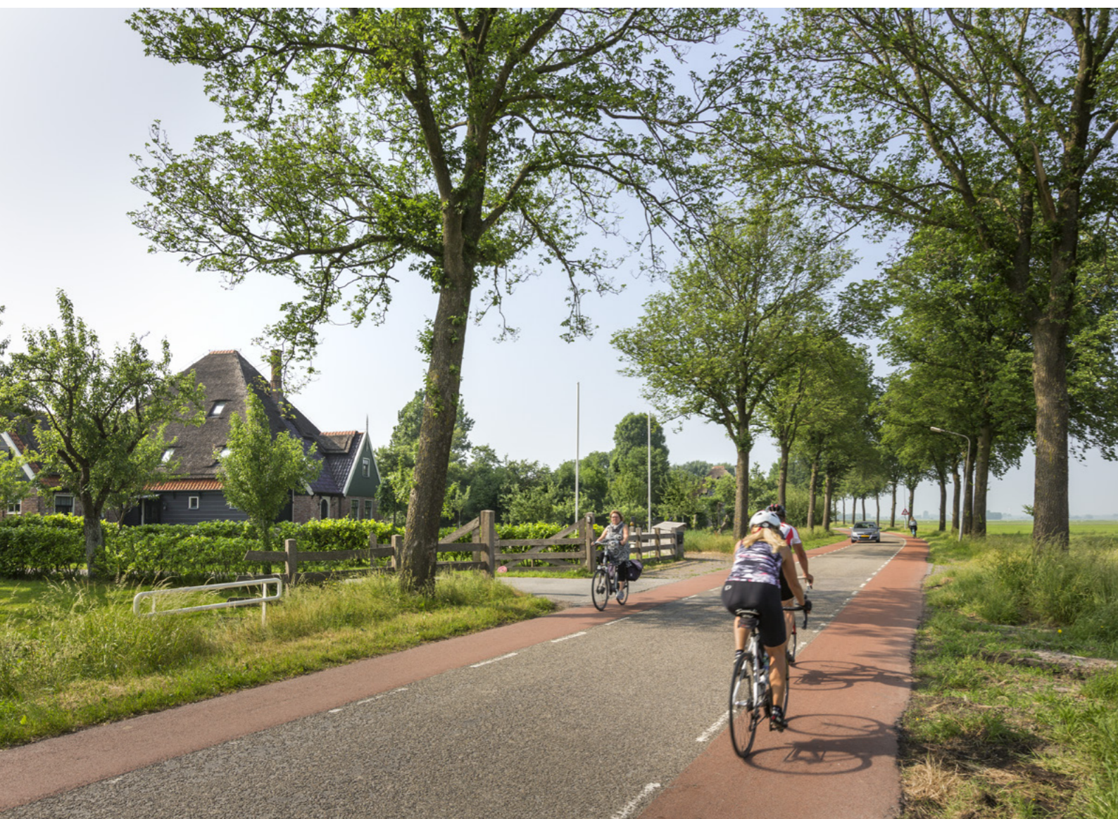
Stolpen en fietsers in Hoogwoud.