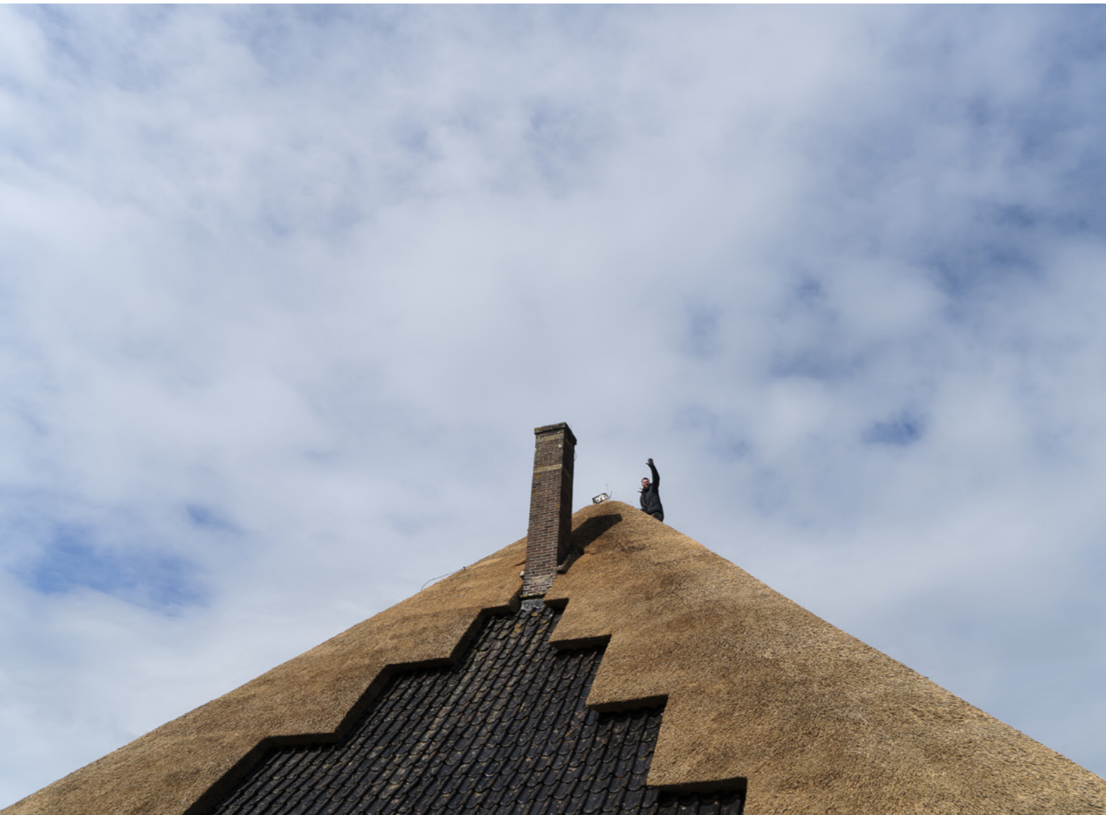
Piramide van de polder.