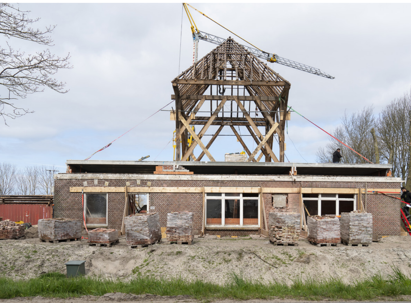
Vierkantconstructie in het zicht.