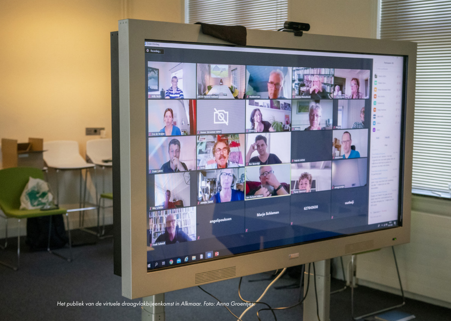
Het publiek van de virtuele draagvlakbijeenkomst in Alkmaar.