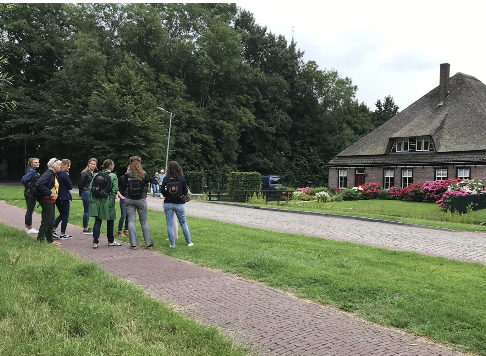
Het onderzoeksteam aan het werk.