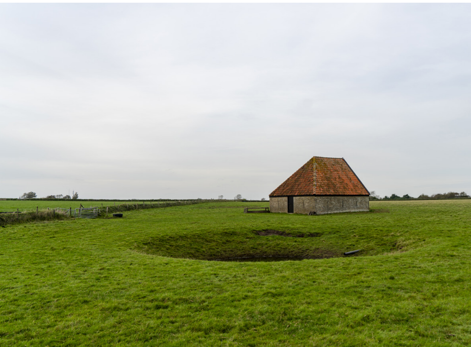
Schansweg Texel.