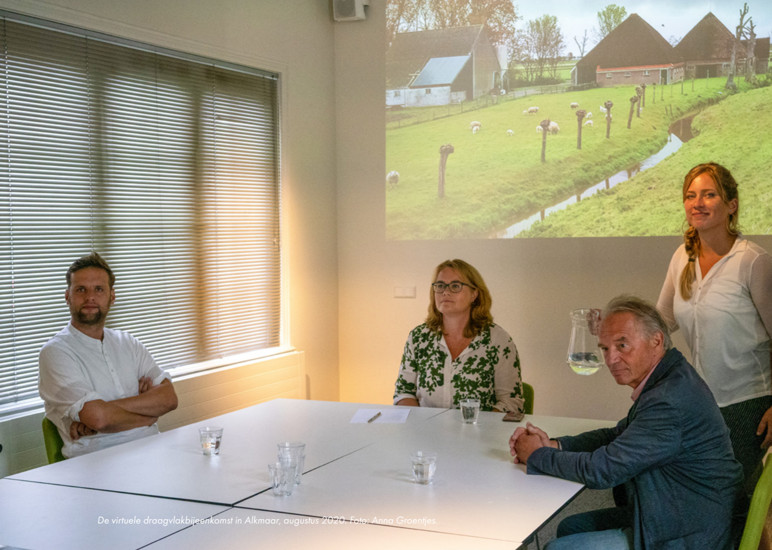
De virtuele draagvlakbijeenkomst in Alkmaar, augustus 2020.