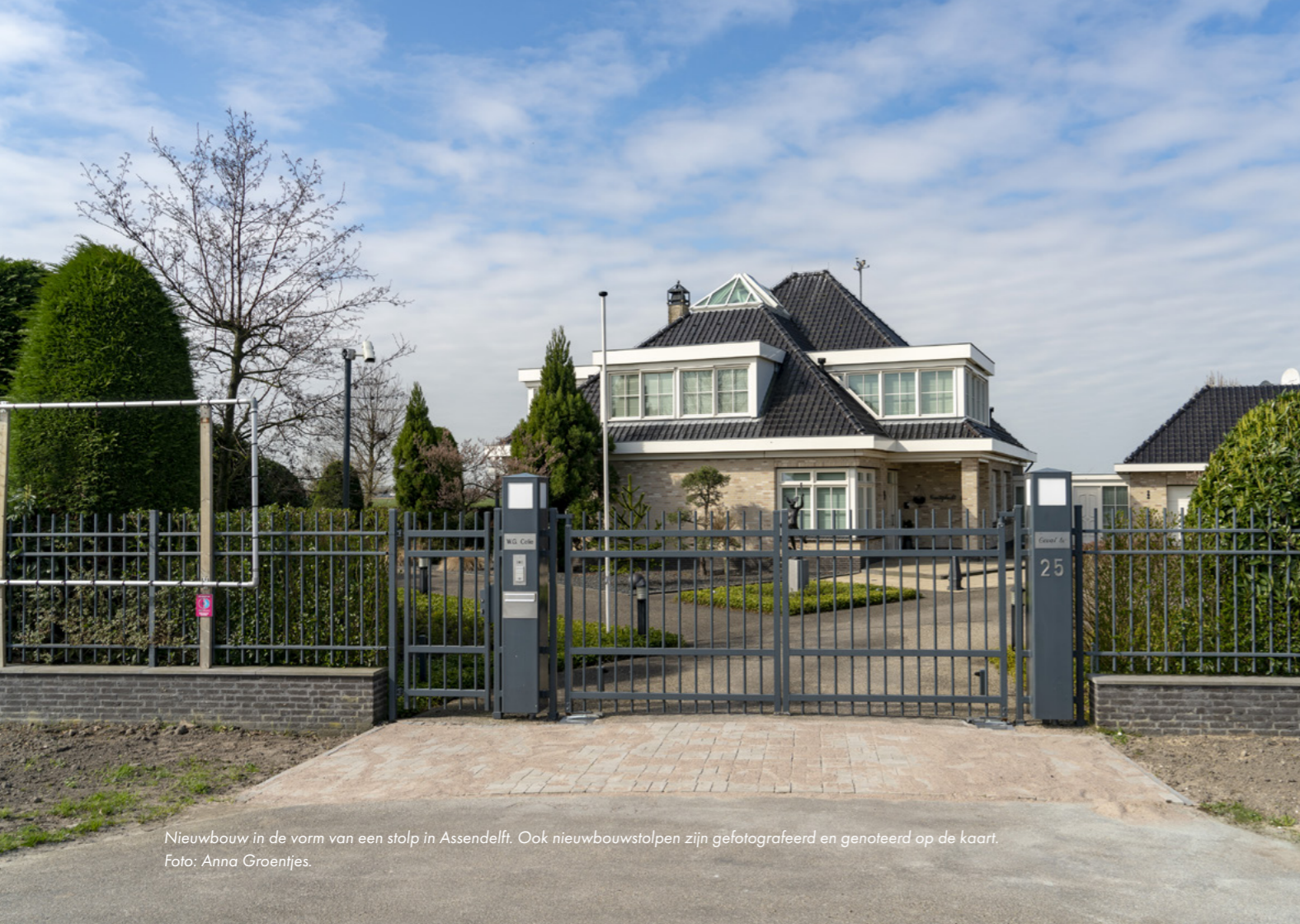
Nieuwbouw in de vorm van een stolp in Assendelft. Ook nieuwbouwstolpen zijn gefotografeerd en genoteerd op de kaart.