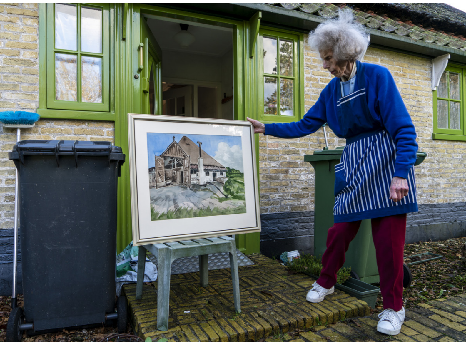
Schilderij van een stolp op Texel. Foto: Anna Groentjes.

(historische) vierkantsconstructie toegepast of hergebruikt. Ook viel het de onderzoekers op dat veel historische stolpen vanaf de jaren zestig zijn verbouwd tot woonboerderijen bijvoorbeeld door het toevoegen van grote ramen. In de naoorlogse periode, toen de crisisjaren voorbij waren en de economie weer opbloede, kwam de tijd van schaalvergroting en mechanisatie in de agrarische sector. Het agrarisch bedrijf groeide en de stolpboerderijen waren als bedrijfspand niet meer toereikend. Het tijdperk van stolpboerderij als bedrijfsgebouw kwam daarmee ten einde.