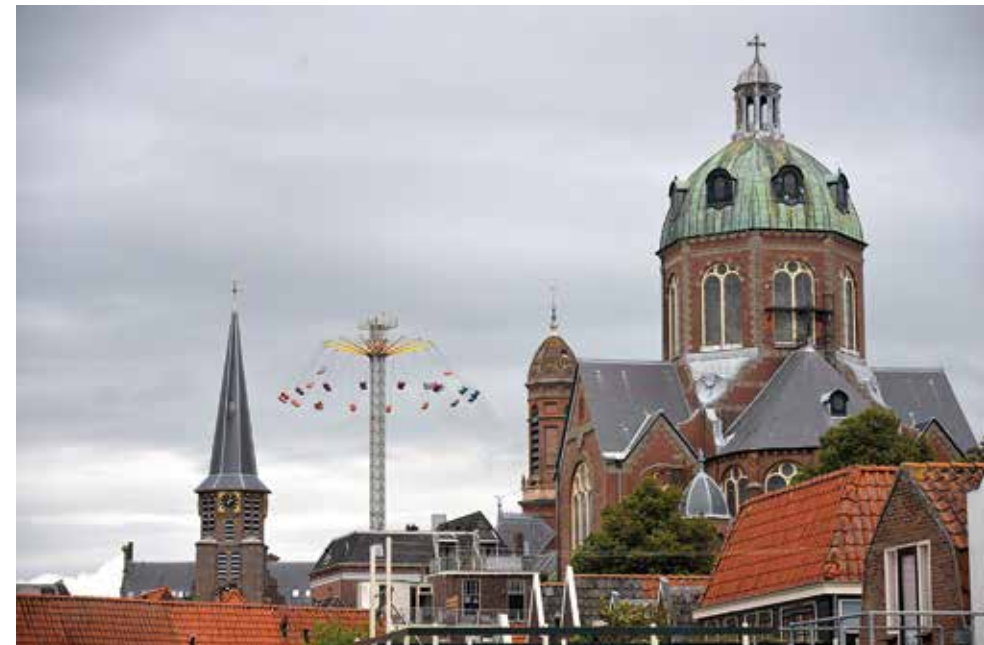
Religieus erfgoed bepaalt voor een groot deel het silhouet van Hoorn. Eens per jaar wordt dit silhouet verrijkt door de attracties van de Hoornse kermis die ook een christelijke oorsprong heeft.

Ook het Platform Religieus Erfgoed wordt genoemd in het erfgoedbeleid; dit platform is immers een belangrijke gesprekspartner van de gemeente als het gaat over het religieus erfgoed. In het platform worden afspraken gemaakt over het geza-