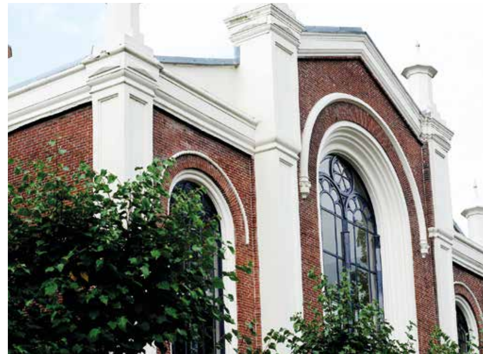
De voormalige Doopsgezinde kerk aan het Ramen is al in 1995 herbestemd tot detailhandel, met op de begane grond bevindt zich een winkel en op de verdieping een kapsalon.

Tot slot kan de kerkenvisie als basis dienen om afwegingen te maken over financiële vraagstukken, juridische vraagstukken, de positie van de kerk in de Hoornse samenleving en het behoud van (monumentale) kerkgebouwen.