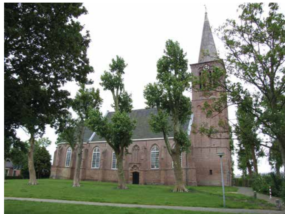
De kerk van Zwaag vormt als bijzonder monumentaal gebouw een herkenningspunt aan het dorpslint en het centrum van de gemeenschap.