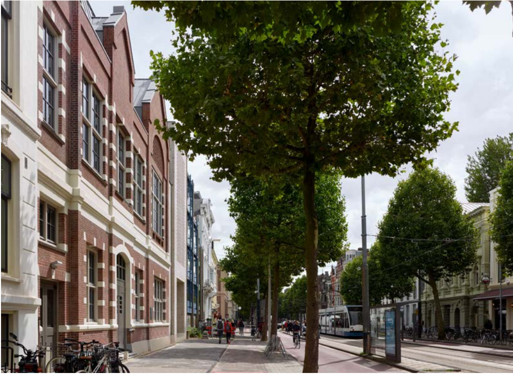
De Plantage Middenlaan met zicht op de Hervormde Kweekschool en Hollandsche Schouwburg