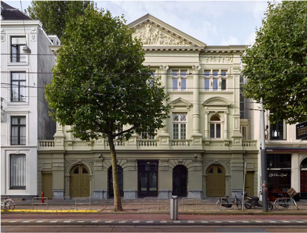
De gevel van de Hollandsche Schouwburg in de oorspronkelijke kleurstelling van Jan Leupen