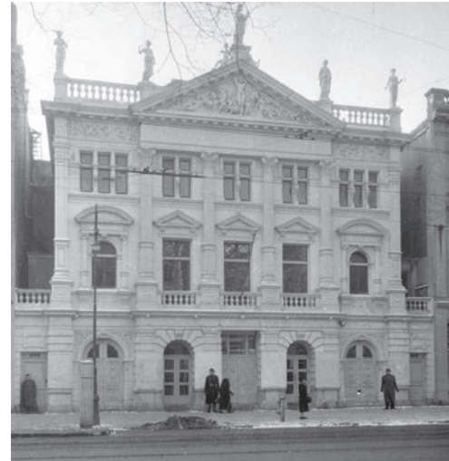
Hollandsche Schouwburg tijdens de Tweede Wereldoorlog met Nazi-bewakers, 1942