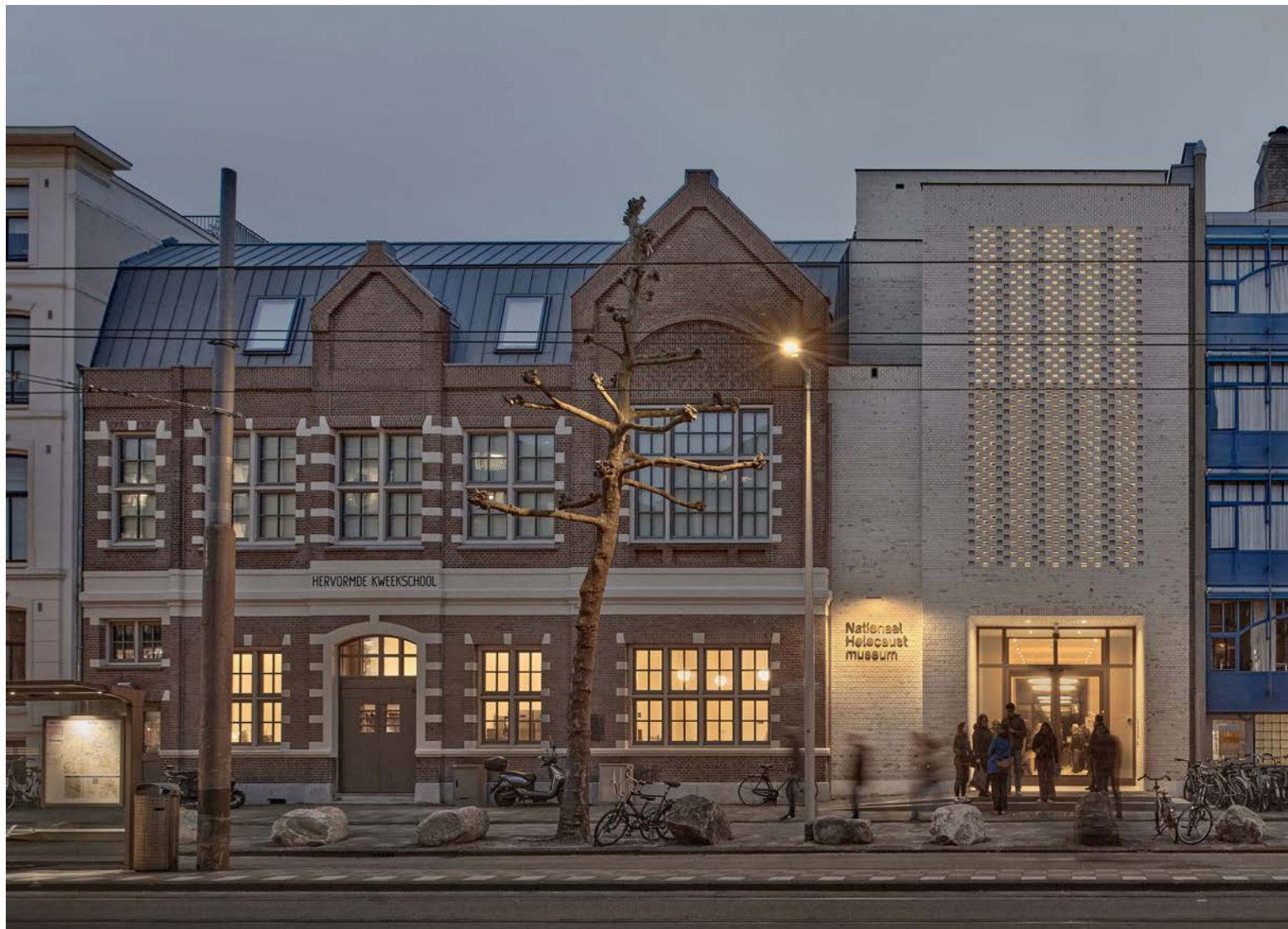
De Hervormde Kweek-school in zijn oorspronkelijke contour en het moderne entreegebouw