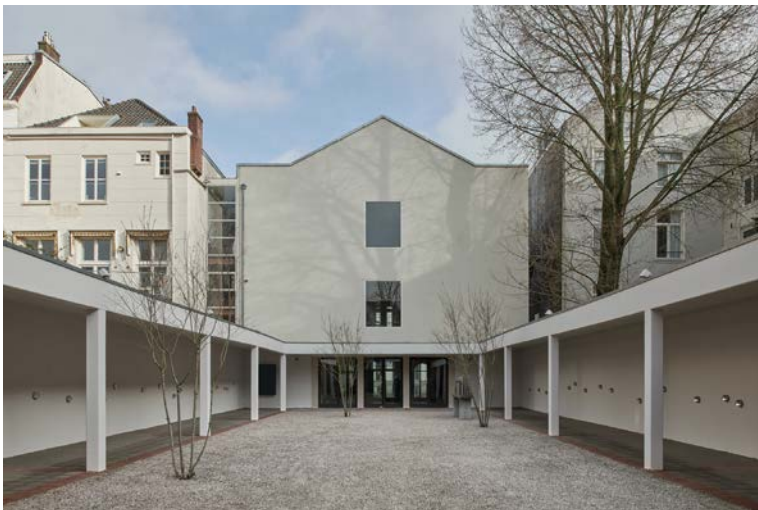
De gerenoveerde binnenplaats van de Hollandsche Schouwburg