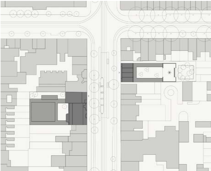
Situatie van de Hollandsche Schouwburg en de Hervormde Kweekschool