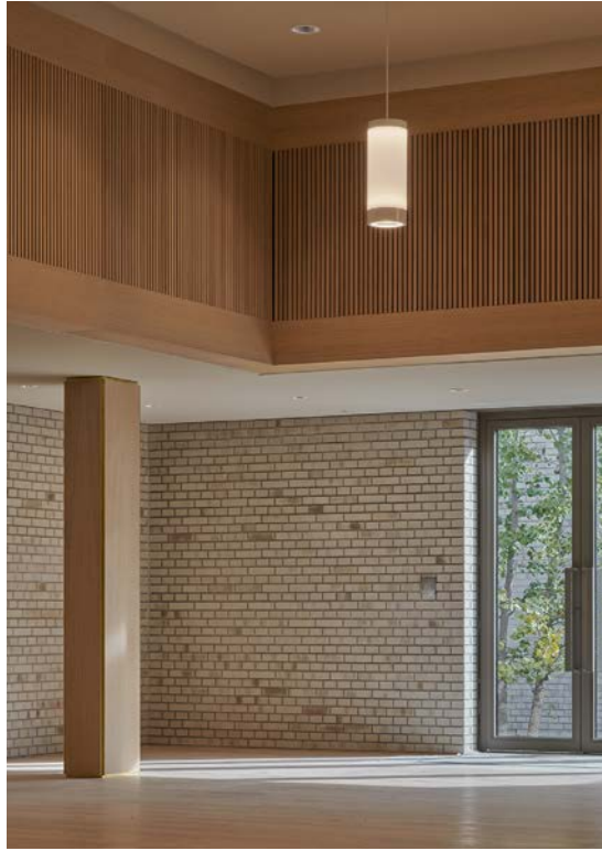
Het auditorium in de nieuwbouw op het achterterrein