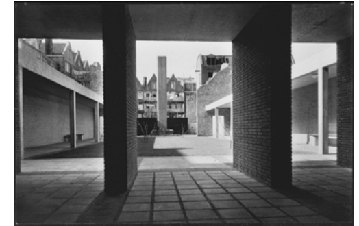
Een open verbinding met de herdenkingsplek ontworpen door Jan Leupen ca. 1960