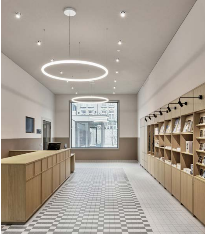
Entree Nationaal Holocaustmuseum