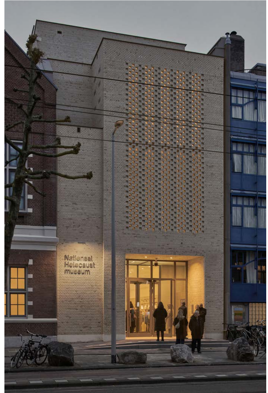
Nieuwe entree Nationaal Holocaustmuseum