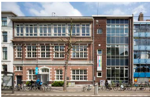
Voor aanvang van de renovatie

Op een bijzondere, beladen plek vertelt het Nationaal Holocaustmuseum de geschiedenis van de Jodenvervolging in Nederland tijdens de Tweede Wereldoorlog. Het museum, geopend in 2024, is gehuisvest in de Hervormde Kweek-school. Het vormt een groter geheel met de Hollandsche Schouwburg aan de overkant van de straat. De Hollandsche Schouwburg, het verzamelpunt van waaruit Joden werden gedeporteerd naar de kampen, was al een herdenkingsplek. Het verhaal van de Hervormde Kweek-school is minder bekend: via dit gebouw werden 600 Joodse kinderen naar onderduik-adressen gebracht. Het museum moet een plek worden om te herdenken en om de geschiedenis aan toekomstige generaties over te brengen. Het doel van het architectonische ontwerp is om de historische elementen van het gebouw die bewaard zijn gebleven, in ere te houden, en om een aaneenschakeling van ruimten te creëren waarin de persoonlijke verhalen uit het verleden voor de museumbezoekers tot leven kunnen komen. Zodat je voelt: dit is hier gebeurd .