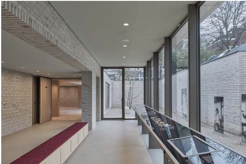
Zicht op de erfafscheiding