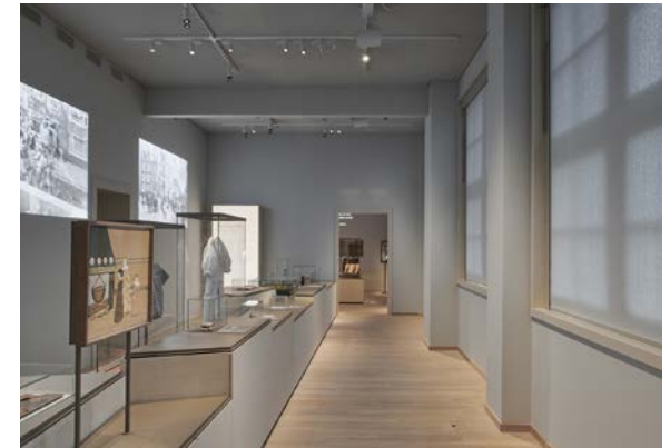
Eén van de vroegere klaslokalen waar zich nu de vaste tentoonstelling bevindt