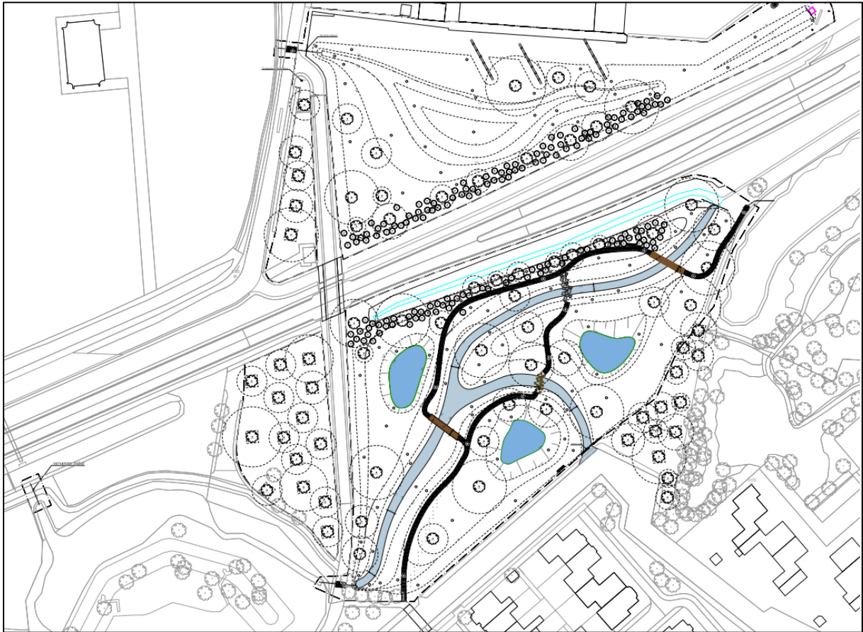
Figuur 2 – Ontwerp waterberging