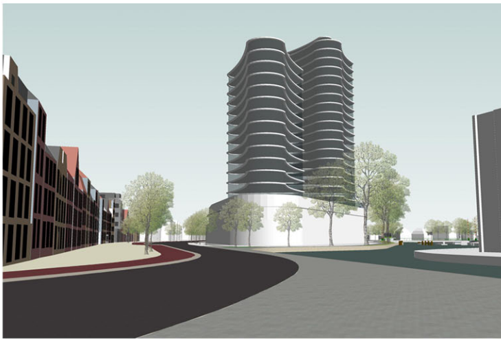
Winnend prijsvraagontwerp DOK