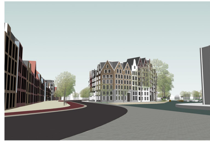
Gerealiseerd ontwerp Mulleners