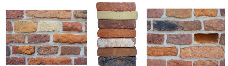
één manifeste uitzondering, een gemengde steen, gebaseerd op de gevel van het Weeshuis