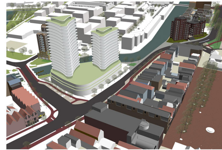
Winnend prijsvraagontwerp DOK