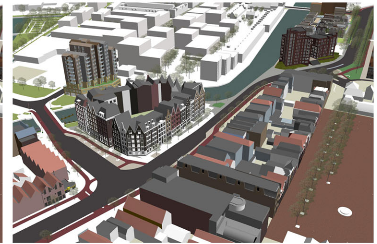
Gerealiseerd ontwerp Mulleners