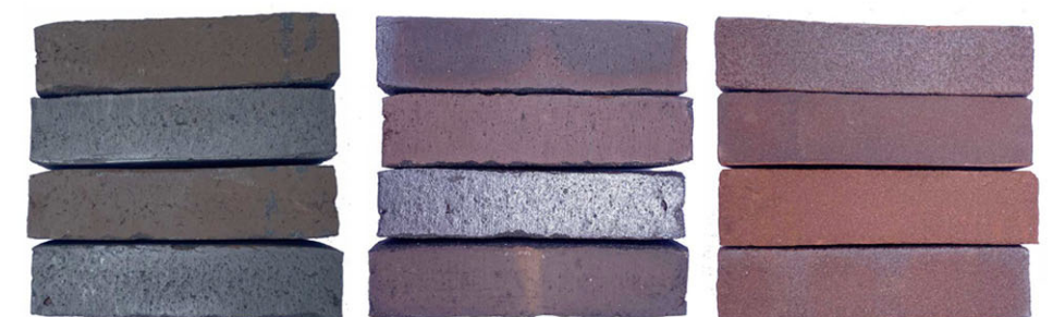
drie bakstenen van donker naar licht(er), strak qua vorm