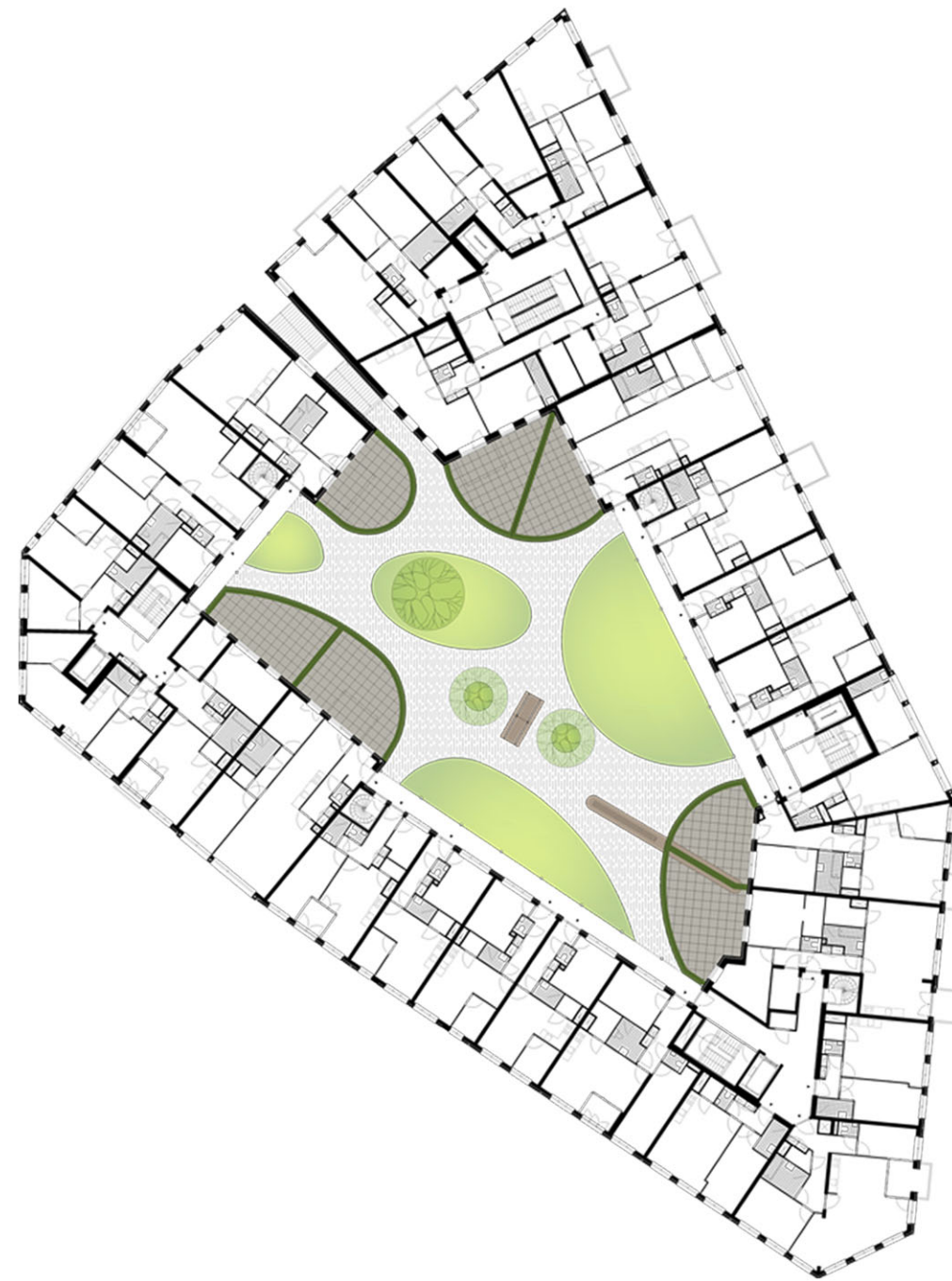
Plattegrond tweede verdieping daktuin