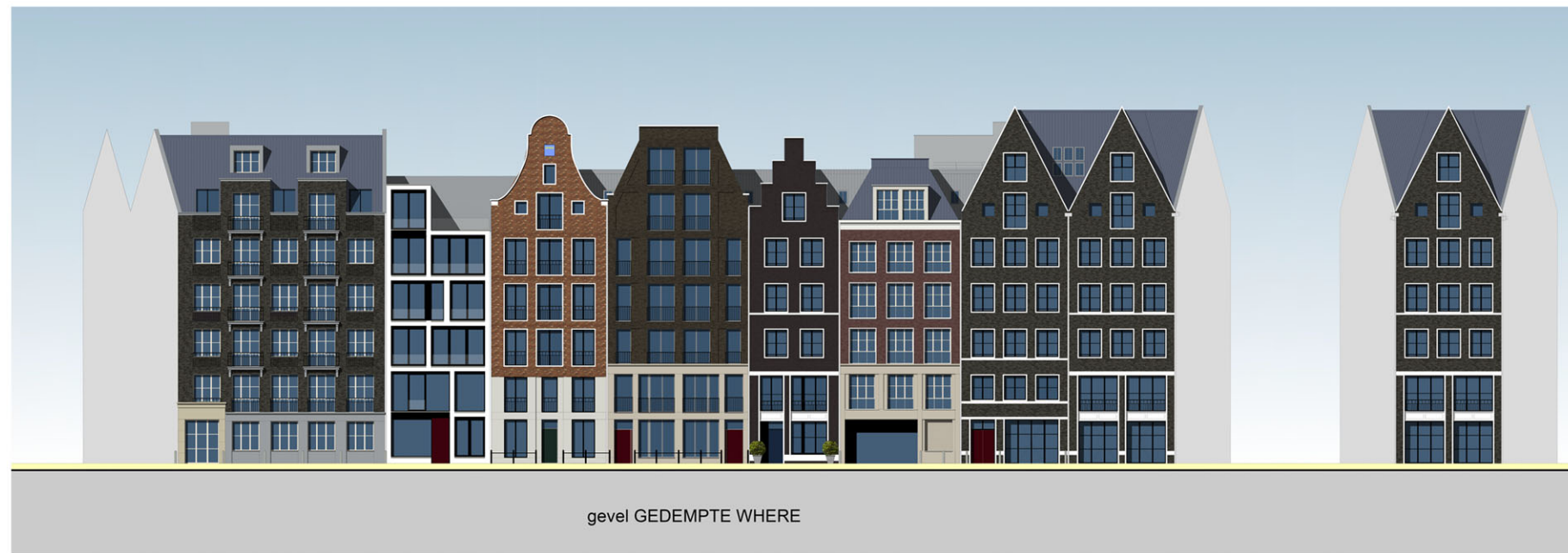
gevel GEDEMPTE WHERE