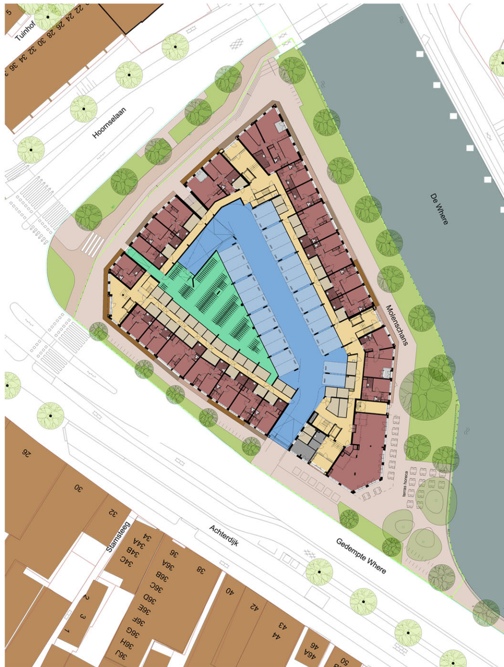
Situatie tekening begane grond