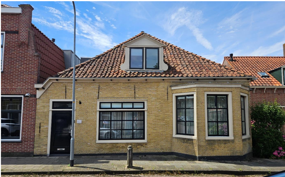
Afb. 7 – Voorgevel (oost)

De dakkapel in het voorgeveldakvlak is voorzien van twee openslaande ramen, met aan de bovenzijde een geprofileerde timpaan en aan weerszijde voorzien van houtsnijwerk. De zijwangen bevatten houten rabatdelen.