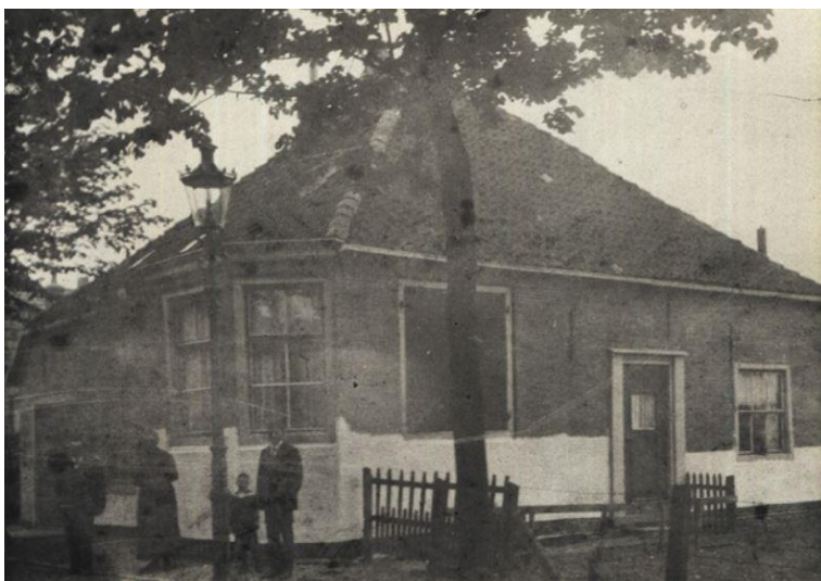
Afb. 4 – Historische foto van Molenweg 69 na vervanging van de houten zij- en achtergevel.

De meeste boerderijen werden aan het water gesitueerd, zodat de boeren gemakkelijk via het water de landerijen buiten de stadswallen konden bereiken. De stolpboerderij aan Molenweg 69 was van oorsprong gesitueerd aan het water tussen de Drie Zalmen en het Hemeltje, dat oorspronkelijk doorliep tot de Noorderboerenvaart. In de jaren '20 van de 20 e eeuw werd een deel van het water gedempt ten behoeve van de herontwikkeling van de Boerenhoek. Het gedempte deel is nu de Nanne Grootstraat. Door de demping was de boerderij niet langer gesitueerd aan het water, maar heeft het aan weerszijde bebouwing, waarvan de rooilijn van nr. 71 en 73 afwijkend is. In de periode die volgde bleven de boerenbedrijven groeien en werd de binnenstad verdicht, waardoor veel boeren in de tweede helft van de 20 e eeuw vertrokken naar locaties buiten de historische stadswallen. Vandaag de dag zijn er slechts 9 stolpboerderijen in de binnenstad van Enkhuizen bewaard gebleven.