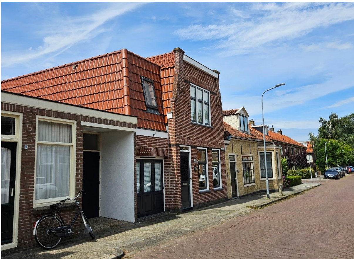
Afb. 6 – Molenweg 69 en belendende panden. Op de foto is te zien hoe de rooilijn van de straat verspringt richting de jaren '40/ '50 wijk in het noorden.

De stolpboerderij wordt ontsloten aan de Molenweg en is direct gelegen aan de straat. Via een steeg aan de Nanne Grootstraat is de achtertuin van de stolp bereikbaar. De achtertuin grenst tevens aan een trafohuisje dat omstreeks 1940 is gebouwd om de nieuwe uitbreidingswijk van stroom te voorzien.