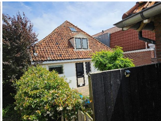
Afb. 9 – Achtergevel (west)