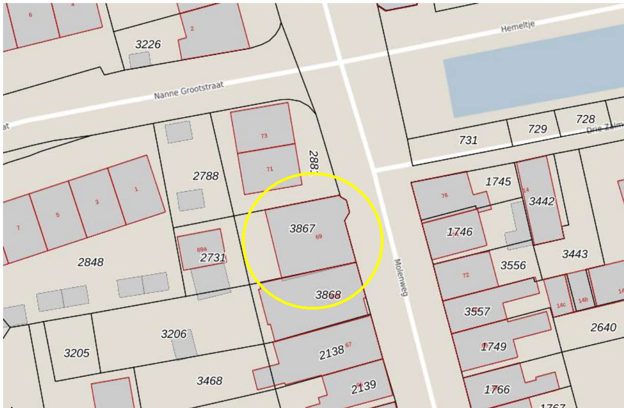
Afb. 2 - Kadastrale kaart. Molenweg 69 is geel omcirkeld.