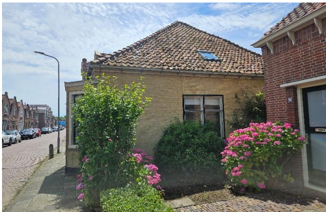
Afb. 8 – Rechter zijgevel (noord)

De gestucte achtergevel wordt beëindigd met een mastgoot, die lager is gelegen ten opzichte van de goot in de rechter zijgevel. In het midden van het dakvlak is een dakkapel aanwezig, voorzien van twee openslaande houten ramen, een timpaan en houten zijwangen. De dakkapel bevat een crèmewitte kleurstelling, en het raamhout heeft een donkergroene kleur. Boven de dakkapel is een dakraam aanwezig. Links bovenin het dakvlak is een glooiing zichtbaar, vermoedelijk ter plaatse van de houten vierkantconstructie.