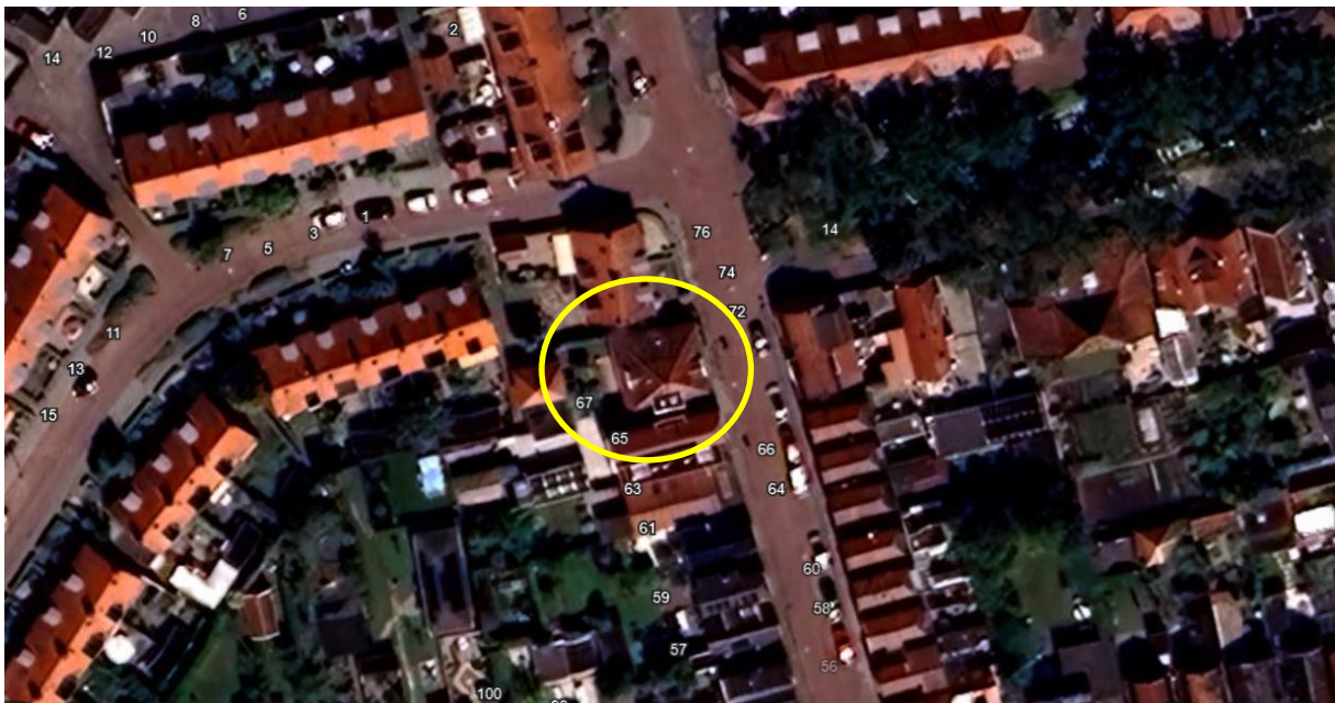
Afb. 3 - Luchtfoto situatie. Molenweg 69 is geel omcirkeld.