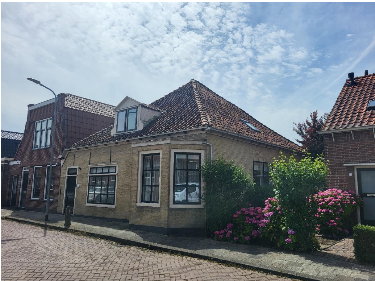
Afb. 1 - Molenweg 69, Enkhuizen.